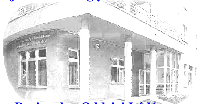
Regionalny Oddział Łódź